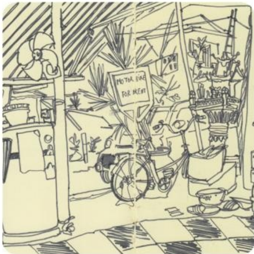
Vientiane - Laos 2018